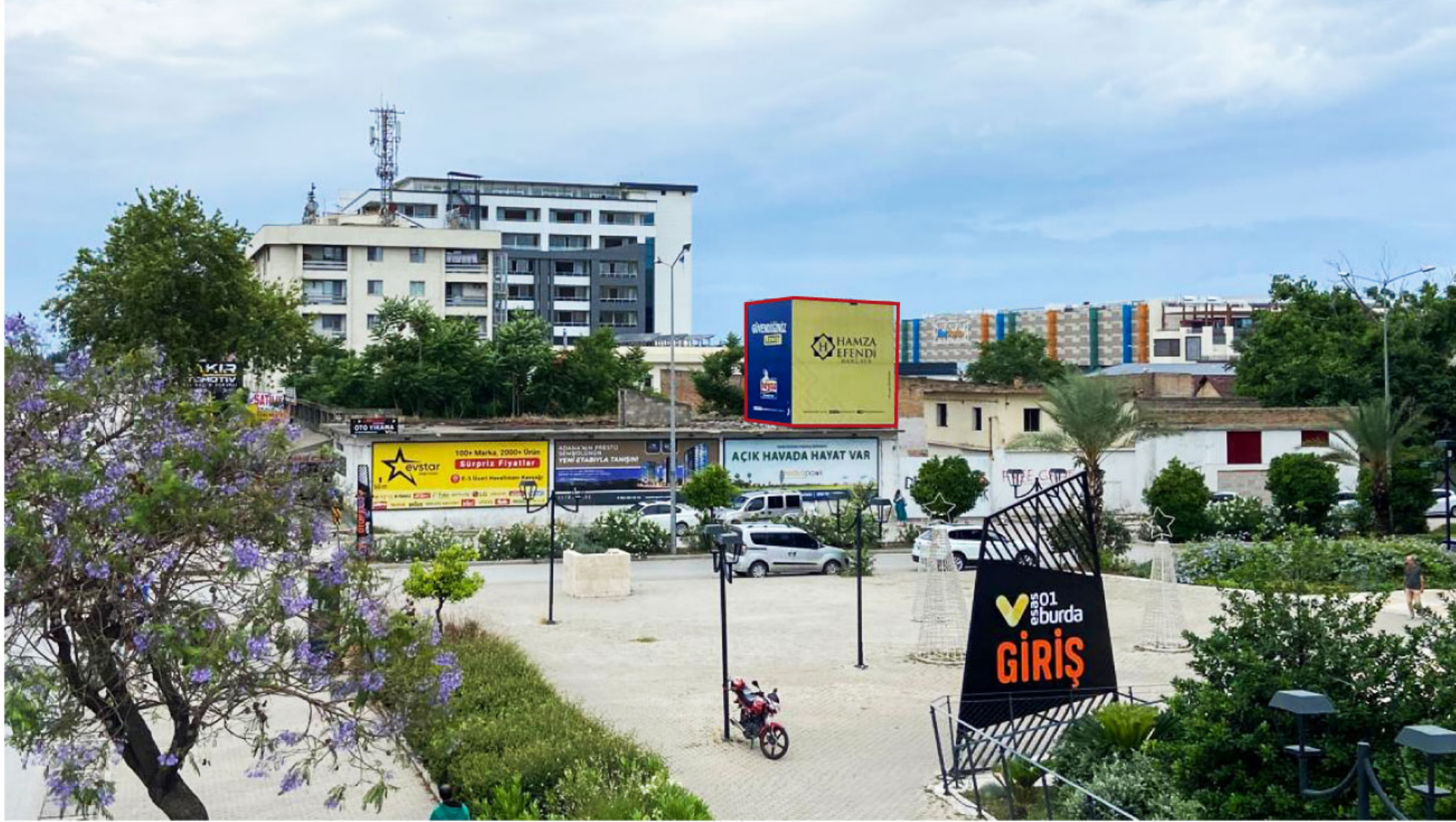
Turhan Cemal Beriker Blv. No:162 D:1, 01130 Seyhan/Adana

Turhan Cemal Beriker Bulvarı (Güney), Dede Korkut Caddesi üzerinde Esas 01 Burda AVM girişi - kapalı otopark girişi karşısında duvar reklam alanlarımız bulunmaktadır. 3 adetten oluşan yüzeyler E5 üzeri geçişlerde, Esas AVM otopark girişinde ve AVM önü yaya trafiği görüş mesafesinde etkilidir.