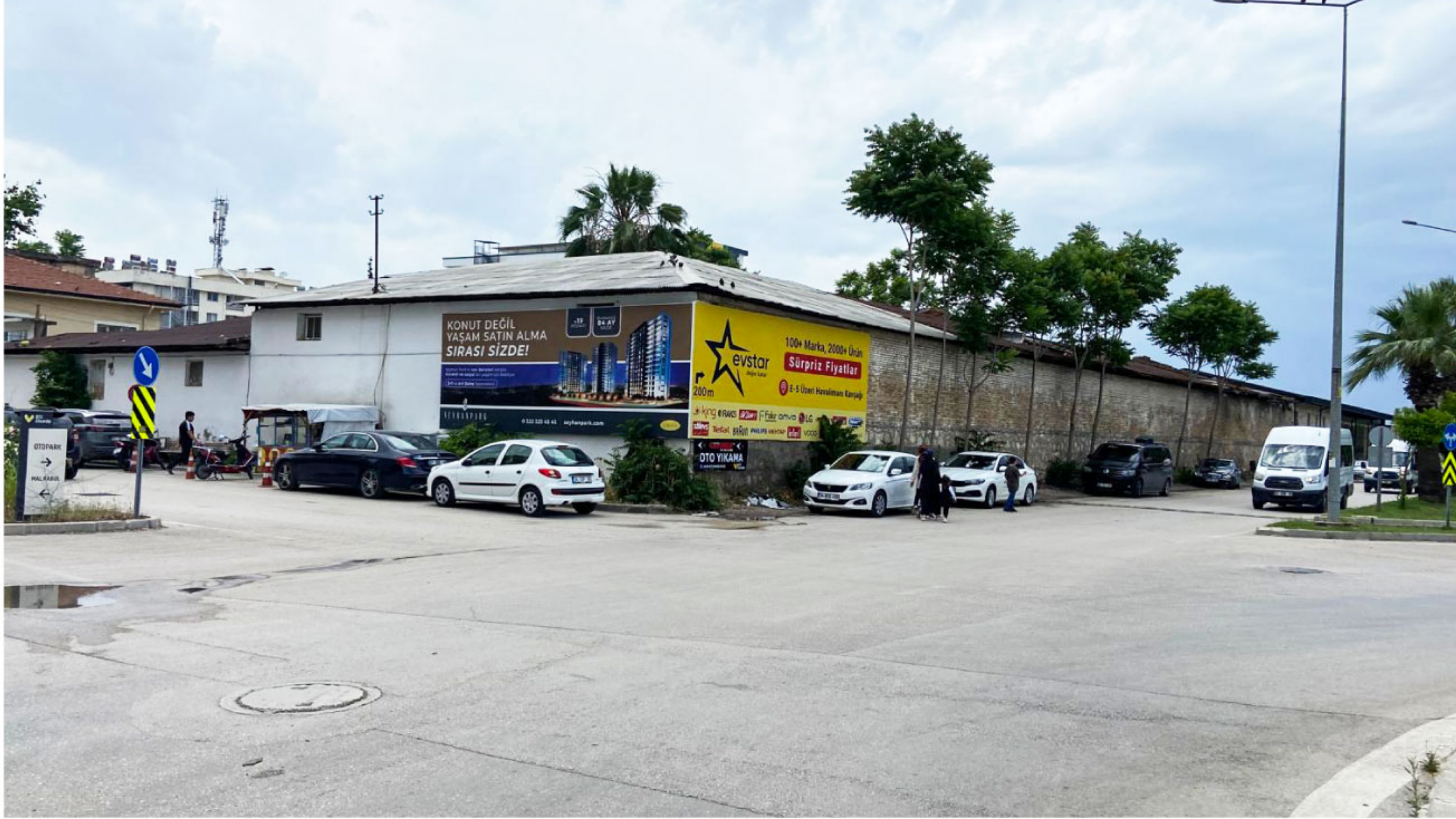
Dede Korkut Cad. 59011 Cad. Kesişimi Seyhan/Adana

Dede Korkut Caddesi üzerinde Esas 01 Burda AVM girişi - kapalı otopark girişi karşısında duvar reklam alanlarımız bulunmaktadır. 2 adetten oluşan yüzeyler Esas AVM otopark girişinde ve AVM yanı yaya trafiği görüş mesafesinde etkilidir.