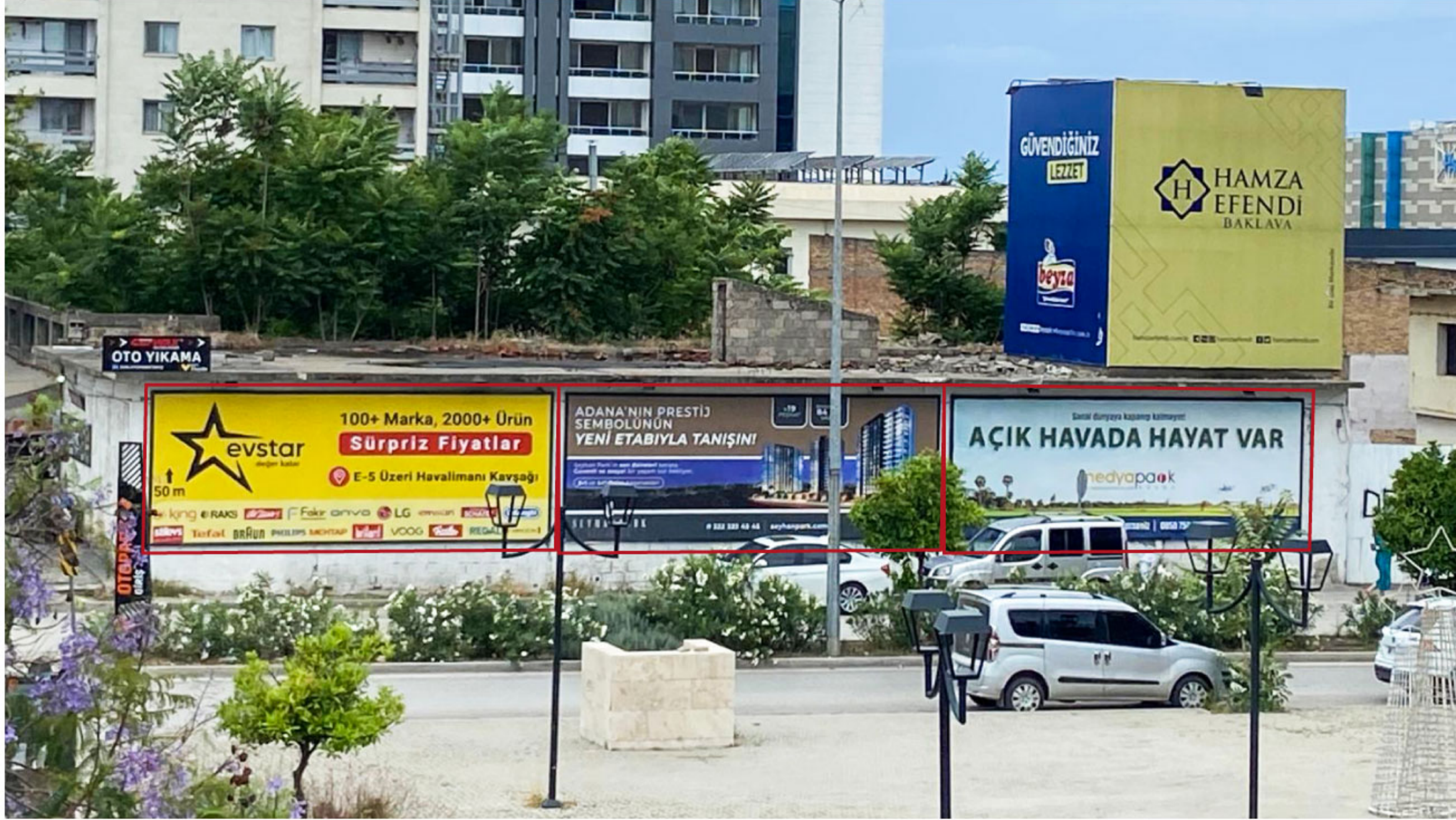
Turhan Cemal Beriker Blv. No:162 D:1, 01130 Seyhan/Adana

Turhan Cemal Beriker Bulvarı (Güney), Dede Korkut Caddesi üzerinde Esas 01 Burda AVM girişi - kapalı otopark girişi karşısında duvar reklam alanlarımız bulunmaktadır. 3 adetten oluşan yüzeyler E5 üzeri geçişlerde, Esas AVM otopark girişinde ve AVM önü yaya trafiği görüş mesafesinde etkilidir.